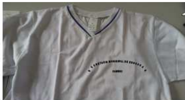
Figura meramente ilustrativa

Para a confecção da camiseta manga curta deve ser usado tecido de malha poliviscose P. V. 65% Poliéster e 35% viscose, fio 30/1, gramatura mínima: 180 g/m 2 , na cor branca. Camiseta manga curta em meia malha PV, na cor branca. A barra do corpo deve estar com largura de 2,0 cm, costurada em máquina galoneira de duas agulhas. A gola deve ser em "V" única, confeccionada em punho ribana 64% poliéster, 32% viscose e 4% de elastano, com largura de 3,00 na peça acabada, com vivo 0,50 cm na cor Royal costurada entre a gola e o corpo. A camiseta deve ser costurada internamente com máquina overloque. A linha utilizada para a confecção da camiseta é 100% poliéster. Na lateral esquerda (de quem veste) da parte da frente deve conter um bordado em azul Royal, com a descrição " SECRETARIA MUNICIPAL DE EDUCAÇÃO CAMBUI " com letras de 1cm de altura. Os bordados devem ser desenvolvidos por programas e máquinas computadorizadas de alta precisão que proporcionam fiel reprodução e acabamento superior. Devem ser