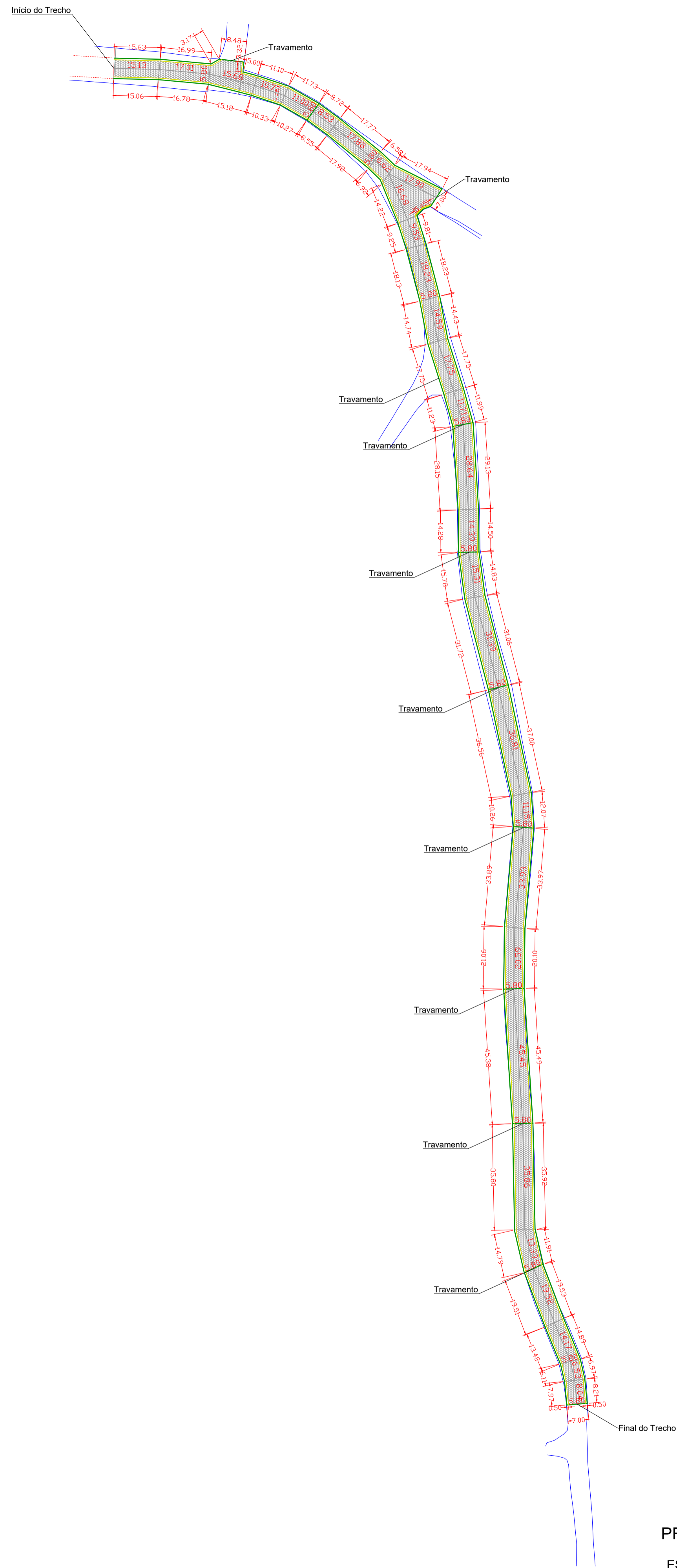
PROJETO MORRO DA ÁGUA BRANCA ESC 1/100